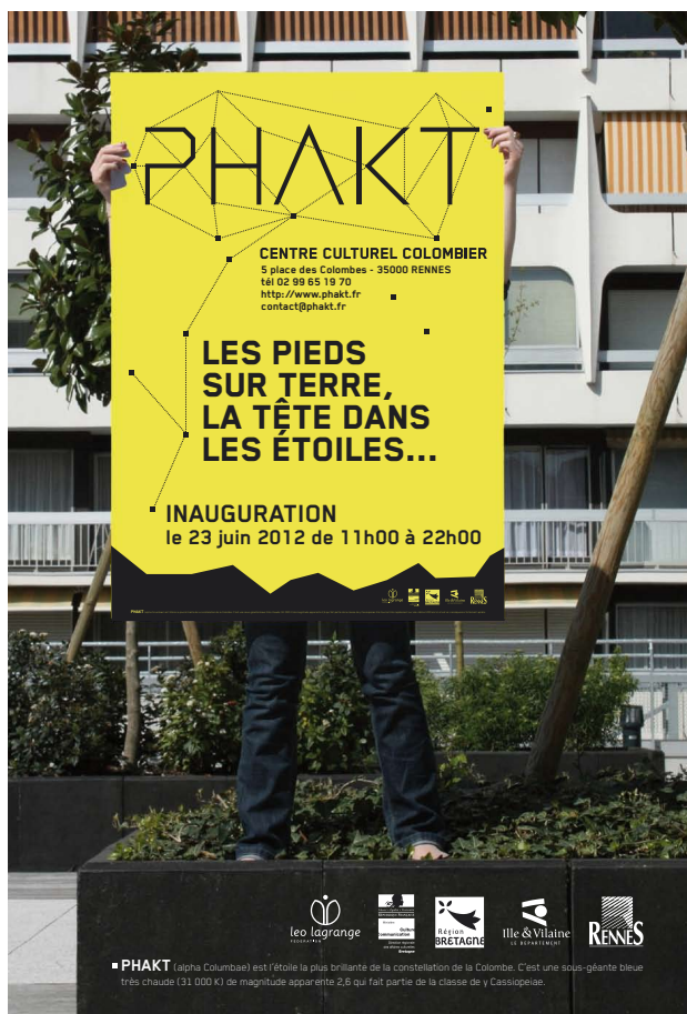
Visuel de l'affiche pour l'inauguration