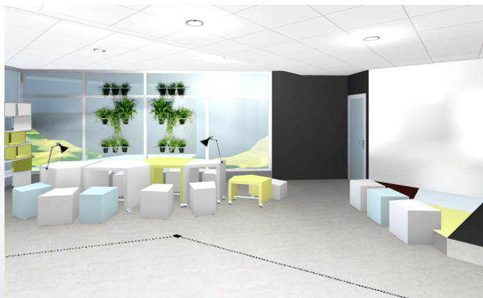
Esquisses préparatoires, Anne-Cécile Gautier, 2012