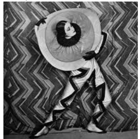
Scène du film Le P'tit Parigot de René Le Somptier 1926, avec des costumes et des tissus de Sonia Delaunay

Cette collection évoque un défilé produit par l'artiste Sonia Delaunay dans les années 20 au sein de l'atelier simultané, point de convergence et d'expérimentation entre l'art et la mode.