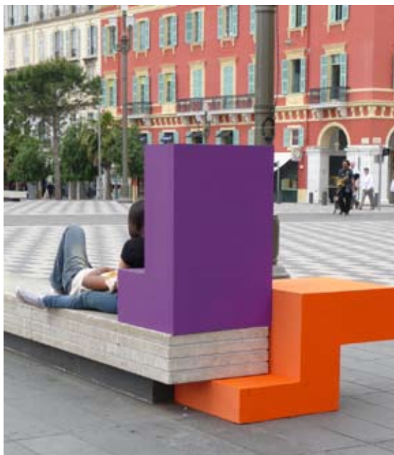
Spinn off blokus, 2009 Sculptures dans l'espace public Modules en bois fixés au mobilier urbain, installation temporaire Intervention produite dans le cadre du festival INDISCIPLINES - Nice Manifestation proposée et organisée par Le Dojo - Nice