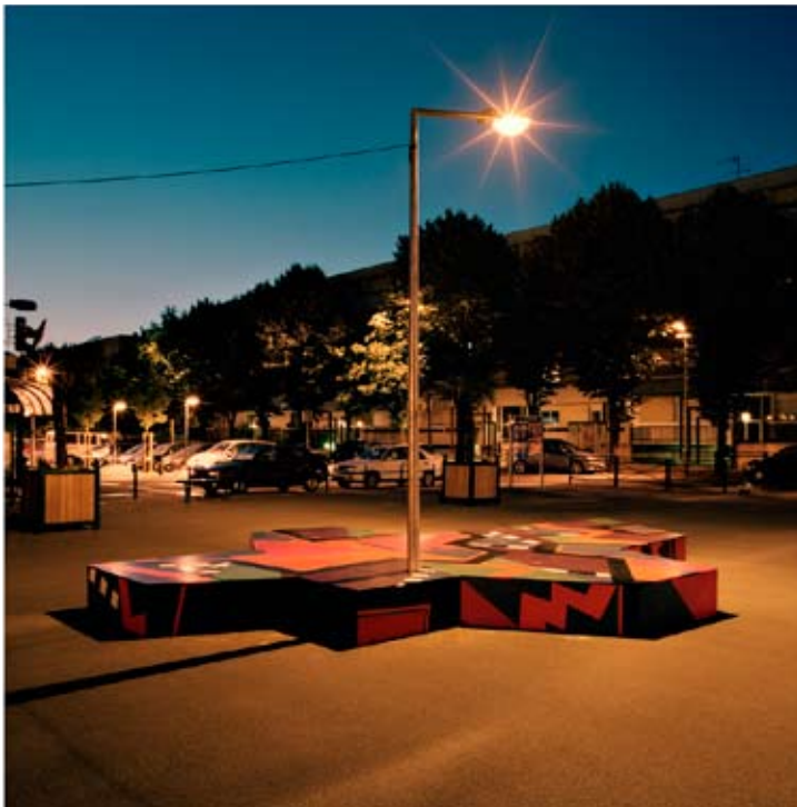
Le Lampadaire, la sculpture et l'espace public, 2010 Sculpture dans l'espace urbain, structure en bois et lampadaire relié à l'éclairage public, installation temporaire Coproducteur de la ville d'Épinay-sous-Sénart et du Conseil Général de l'Essonne