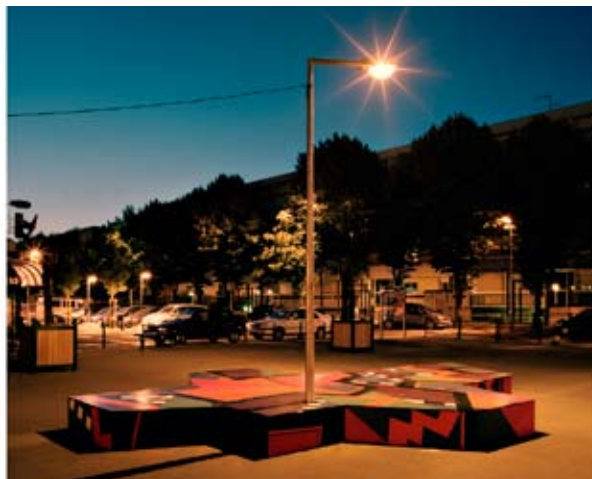
Le Lampadaire, la sculpture et l'espace public, 2010 Sculpture dans l'espace urbain, structure en bois et lampadaire relié à l'éclairage public, installation temporaire Coproduction de la ville d'Épinay-sous-Sénart et du Conseil Général de l'Essonne

L'ensemble des interventions est conçu à partir des motifs graphiques produits pendant les ateliers avec les habitants. Sur une base textile déclinable, l'artiste produit des objets, investit l'espace public activant différents protocoles de rencontres.