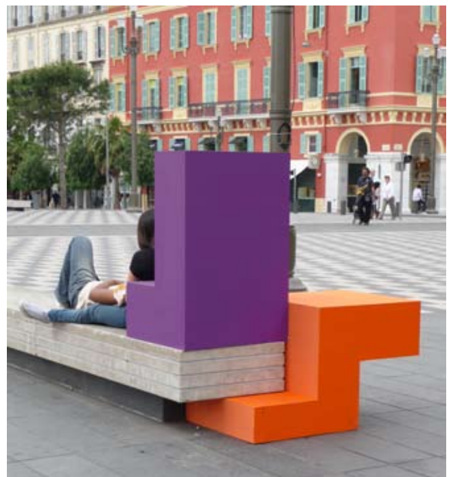
Spinn off blokus, 2009 Sculptures dans l'espace public Modules en bois fixés au mobilier urbain, installation temporaire Intervention produite dans le cadre du festival INDISCIPLINES - Nice Manifestation proposée et organisée par Le Dojo - Nice