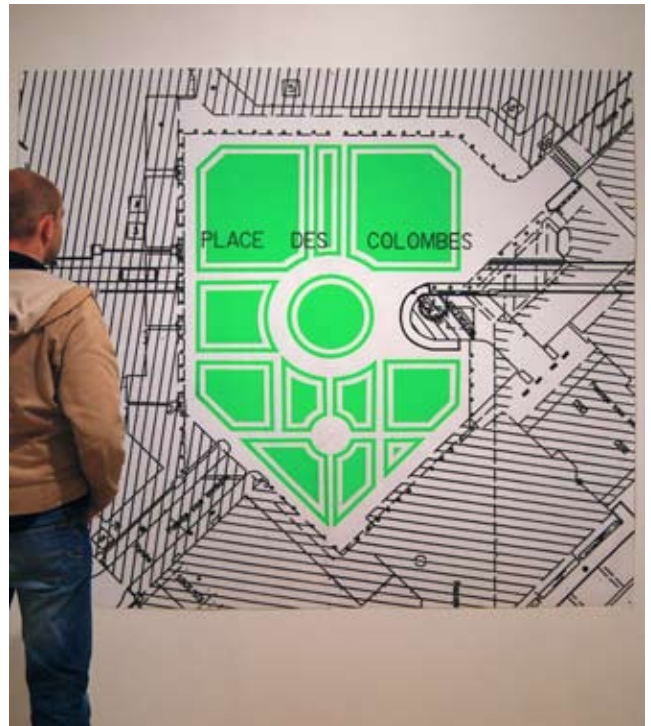
Crop Circle, 2006 Dessin de projet pour la place des Colombes à Rennes, sérigraphie, largeur 180 x hauteur 160 cm Oeuvre produite dans le cadre de l'exposition Puck, Galerie du Colombier, Rennes