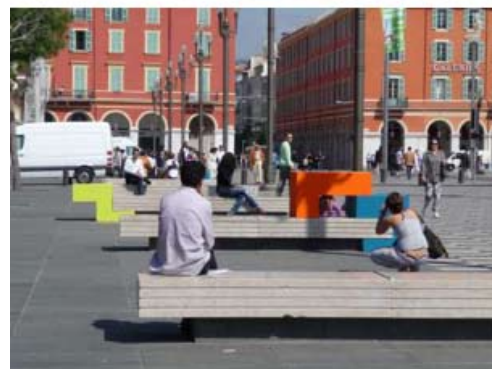
Spinn off blokus, 2009