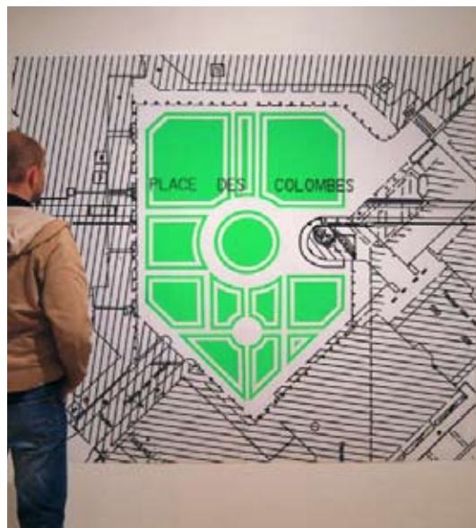
Crop Circle, 2006 Dessin de projet pour la place des Colombes à Rennes, sérigraphie, largeur 180 x hauteur 160 cm Oeuvre produite dans le cadre de l'exposition Puck, Galerie du Colombier, Rennes

En parallèle des productions dans l'espace public, l'exposition décline une série de productions imaginées par l'artiste dans la lignée des recherches de terrain menées aux cours des différents ateliers.