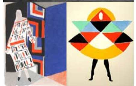
A gauche : Robe-Poème femme au paravent de Sonia Delaunay, 1924 / A droite : Robe-Poème danseuse de Sonia Delaunay, 1923