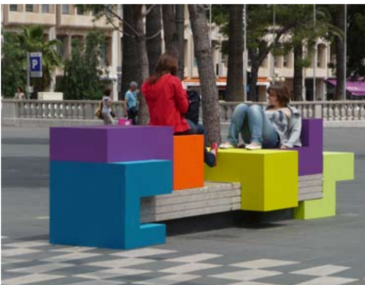
Spinn off blokus, 2009 Sculptures dans l'espace public Modules en bois fixés au mobilier urbain, installation temporaire Intervention produite dans le cadre du festival INDISCIPLINES - Nice Manifestation proposée et organisée par Le Dojo - Nice