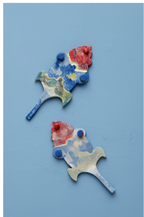
Amours, marguerites et troubadours , 2023, CAC Passerelle, Brest, © photo : Aurelien Mole