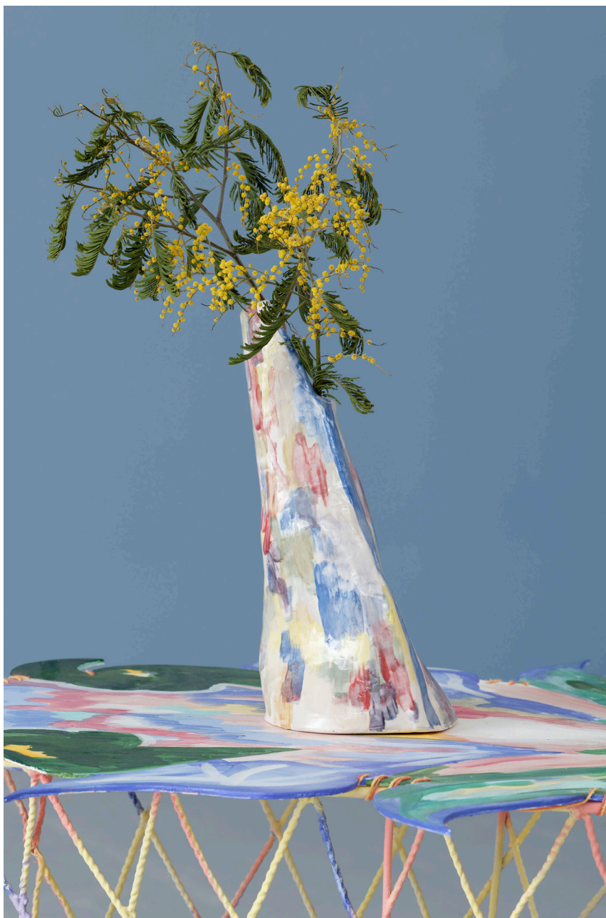
Amours, marguerites et troubadours , 2023, CAC Passerelle, Brest, © photo : Aurelien Mole