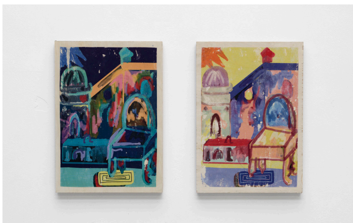
Amours, marguerites et troubadours, 2023, CAC Passerelle, Brest