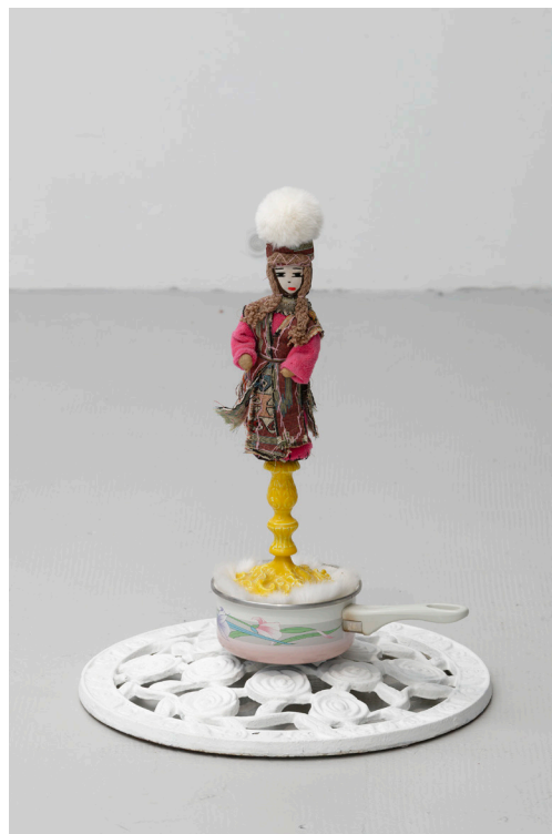
Amours, marguerites et troubadours , 2023, CAC Passerelle, Brest